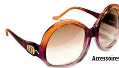
Accessoires: nie verkehrt.

„Denim“ dich! | Im weiblichen Kleiderschrank trifft dieses Frühjahr das Unfertige auf Altbekanntes. Viele Frühjahrskollektionen sind von einer Back-to-the-roots-Gesinnung geprägt. „Das macht sich in der Auswahl der Stoffe und in der Konstruktion der Looks bemerkbar“, erklärt Rottensteiner. So war das weite, etwas hoch gekrempelte Beinkleid in Form der Boyfriend-Jeans für sie zwar in der vergangenen Modesaison, kombiniert mit Blazer und High Heels, an schlanken Frauen bereits ein Hingucker. Die Revitalisierung des lang in der Versenkung verschwundenen Jeanshemds, das sowohl Frauen als auch Männer diesen Frühling tra-